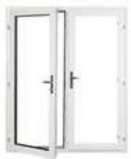
Porte française avec pleine ouverture (pentures sur les côtés et astragale)