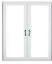
Porte-terrasse avec meneau central fixe (possibilité de pentures sur les murs extérieurs ou sur le meneau)